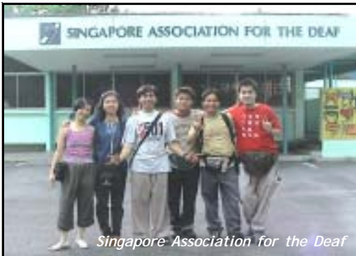
Singapore Association for the Deaf

Destinasi pertama yang kami tuju ialah Ngee Ann Polytechnic yang terletak di Clementi Road. Politeknik tersebut mula dibuka kepada orang Pekak yang ingin melanjutkan pengajian sejak tahun 1981. Kini 15 orang pelajar Pekak sedang