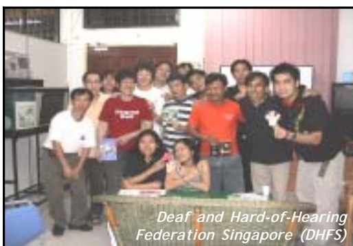
Deaf and Hard-of-Hearing Federation Singapore (DHFS)

Pada hari berikutnya, kami telah melawat ke TOUCH Community Silent Club yang terletak di barat Singapura. Kami banyak belajar tentang kelab ini dan pentadbirannya. Kelab ini telah mengejutkan kami dengan jumlah ahlinya adalah lebih daripada 200 orang. Kelab ini membantu orang Pekak yang bermasalah dan memberi sokongan positif kepada mereka. Selain daripada ini, kami juga diperkenalkan kepada sekumpulan ahli-ahli kelab ini